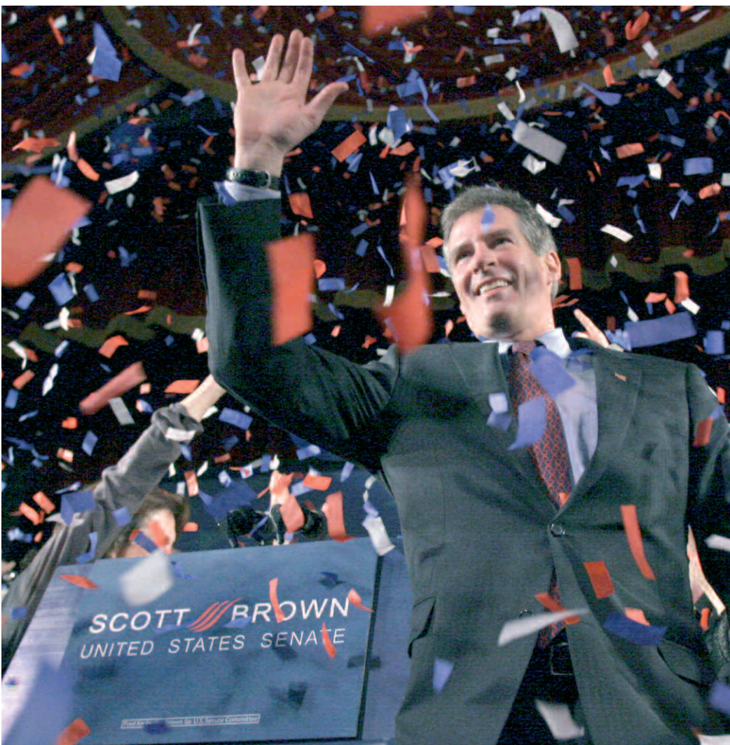
Il nuovo senatore junior del Massachusetts, il repubblicano Scott Brown. Nella pagina a fianco, Ted Kennedy (a sinistra) e Marta Coakley (a destra)

è ormai stabilmente al di sotto della linea di galleggiamento del 50%; il suo partito perde regolarmente le sfide nel congressional generic ballot ; la riforma sanitaria è a rischio; la sua politica economica ha indici di approvazione che sfiorano il 30%; i potenziali candidati democratici alle elezioni di mid-term ( incumbent compresi) fanno a gara nel ritirarsi dalla competizione; i repubblicani, che sembravano definitivamente usciti di gioco, sono più motivati e combattivi che mai; i